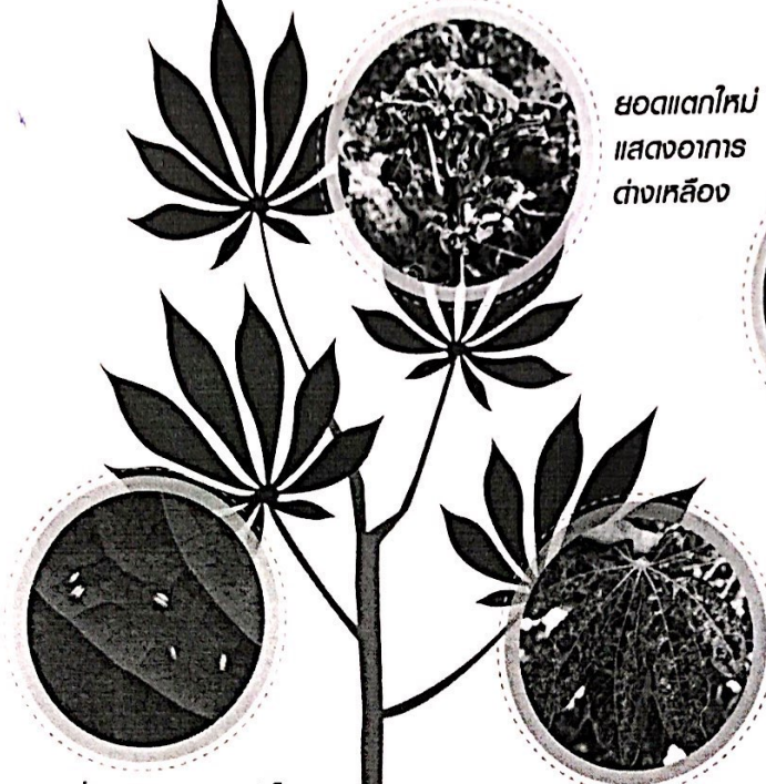
ยอดแตกใหม่ แสดงอาการ ด่างเหลือง