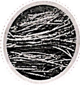
ท่อนพันธุ์