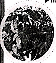
ลำต้นแคระแกร็น

▶ พืชอาศัยของเชื้อไวรัส : มันสำปะหลัง สมุดดำ ละหุ่งและ พืชตระกูลยางพารา