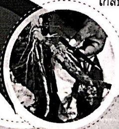
พาวลิคเสียหยา 80-100 %